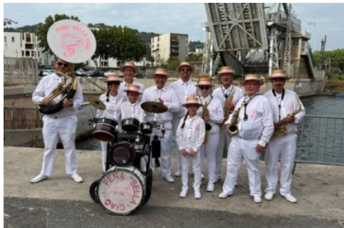
©La peña Bella Ciao

Laissez-vous emporter par l'énergie contagieuse de la peña Bella Ciao ! Pendant deux heures, les musiciens déambuleront sur les quais, offrant un moment de fête et de convivialité au rythme des cuivres et des percussions. Une ambiance chaleureuse et populaire à ne pas manquer !